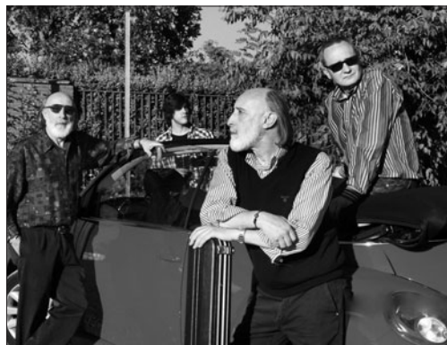
Mágicos 70's despertará hoy muchos recuerdos musicales. DL