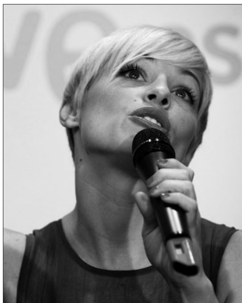
Imagen de archivo de Soraya Arnelas. FERNANDO ALVARADO