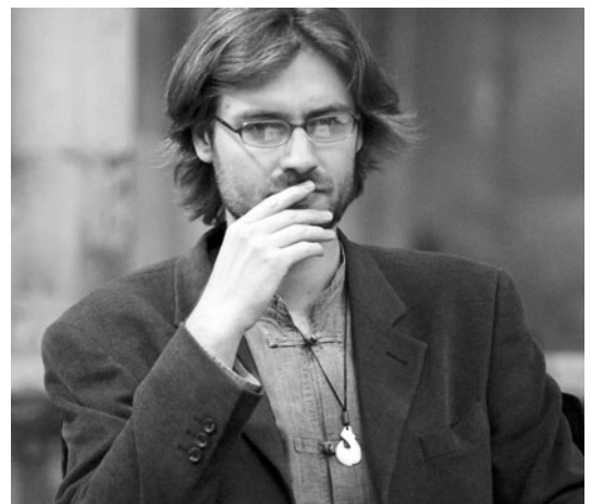
Imagen del poeta Rafael Saravia

■ ■ ■ Lugar: Sala región. Instituto Leonés de Cultura. Hora: 20.30.