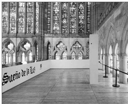
Imagen de la plataforma de visitas de la Catedral.

des de la ANP, Hamdán Taha. La posibilidad de que la ciudad palestina adquiriera esa denominación fue elevada por primera vez en una reunión anual de la Unesco en Durban (Sudáfrica) en 2005, aunque el inventario y el expediente de la candidatura no se elaboraron hasta el año pasado, y fue presentada de manera oficial en enero último, precisó Taha. «Esperamos que tras la presentación oficial podamos incluir a la histórica ciudad vieja de Belén entre los monumentos Patrimonio de la Humanidad», expresó el viceministro de Turismo palestino. Subrayó que la de Belén es la primera candidatura de este tipo que prepara la ANP, y que con su eventual aceptación se espera que la sigan ciudades como Jericó, Hebrón, Naplusa o Sebastia.