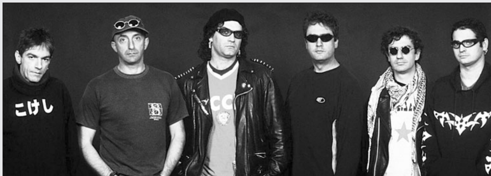
La banda sevillana lleva más de veinte años denunciando, a golpe de canción, las fisuras del sistema. DL