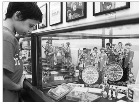
Un niño contempla una maqueta de la banda. LEO LAVALLE

Asimismo, ha recordado que, al igual que sucediera en 2010, las creaciones de los jóvenes volverán a viajar a Japón y a Bruselas, al tiempo que ha aludido a las negociaciones que está llevando a cabo el Instituto que dirige para poder exponer en México. Respecto al «Certamen Jóvenes Artistas de Castilla La Mancha 2010» ha señalado que participan un total de 35 artistas en las modalidades de artes plásticas, fotografía, cómic e ilustración.