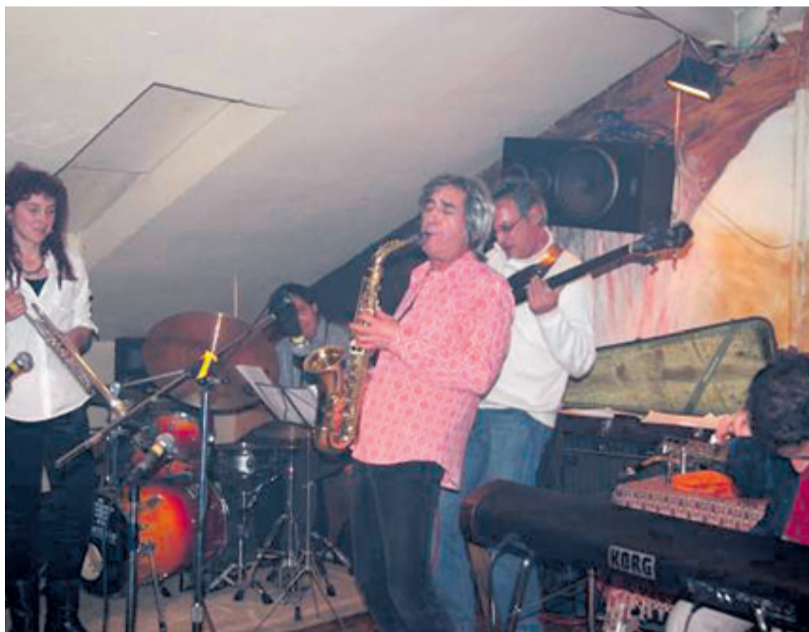
El gusto por la música une a los cinco integrantes de Quinteto Asimétrico.