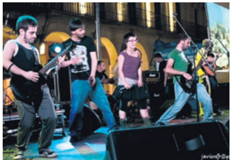
Duendes Escapaos ya sabe lo que es triunfar en el Territorio Bosco.