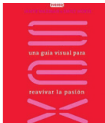
Dos historias de amor para adolescentes y una guía para ampliar tu vida sexual completan la oferta de Everest.

El cuarto título sería 'El cielo está en cualquier lugar', una historia para jóvenes románticos, la historia de una joven de 17 años, lectora empedernida y fanática de la música.