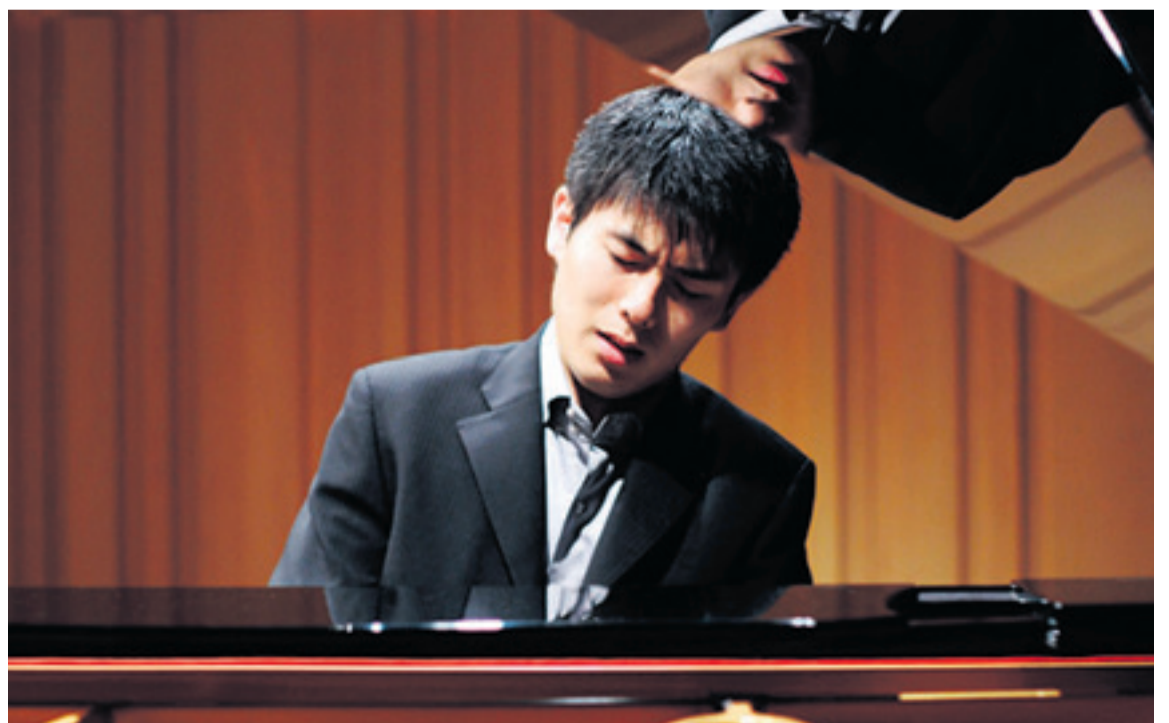
Un momento de un concierto del famoso pianista japonés Kotaro Fukuma, que hoy estará en el Auditorio.

Los leoneses tiene hoy una oportunidad única de verlo. ✘