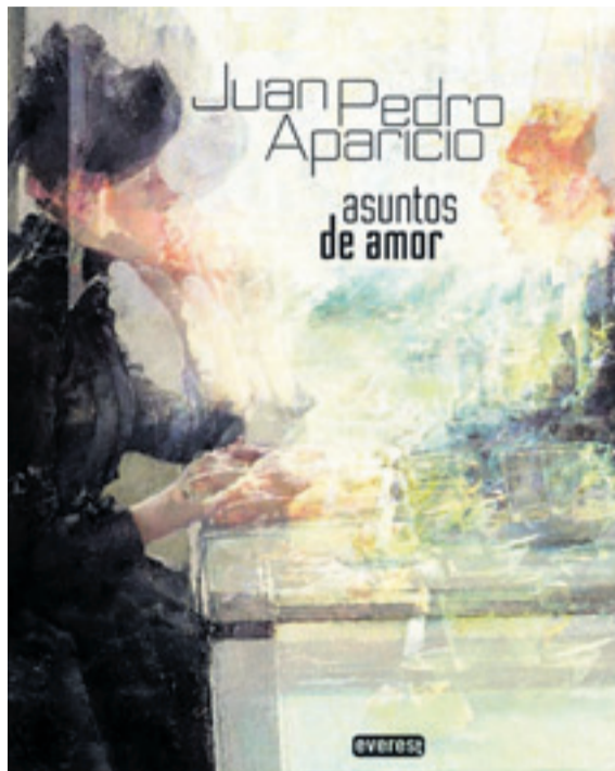
Juan Pedro Aparicio nos ofrece sus relatos de amor y Blue Jeans hace doblete con una reedición y una novedad.

Ante la excelente acogida de 'Canciones para Paula', del que lanzan la tercera edición, también han editado la segunda parte de esta novela, '¿sabes que te quiero?', del autor sevillano Francisco de Paula Fernández, más conocido por el pseudónimo Blue Jeans, que continúa las aventuras amorosas de Paula y sus amigas.