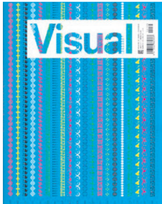
El mundo de la arquitectura y el urbanismo están tratados en 'Arquitectura viva', el del diseño en 'Visual'.