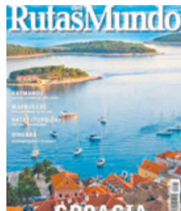
Los asuntos que abordan las diversas revistas van desde los toros al pensamiento o los viajes por el mundo.

yos principios están basados en la responsabilidad social; 6Toros6 , publicación de información taurina; Filosofía Hoy , para los que quieren pensar, opinar, divertirse,