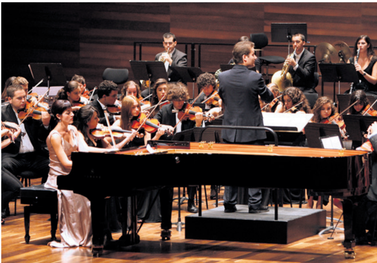
Un momento del gran concierto ofrecido ayer en el VIII Curso de Piano y Dirección de Orquesta que hoy tiene una nueva cita. M. MARCOS

Seguirá el Concierto nº 2 de Liszt en la mayor, con Aleksandra